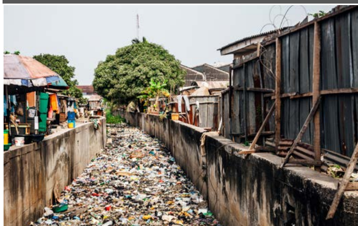
Anexo 2. Residuos en una comunidad en Nigeria.