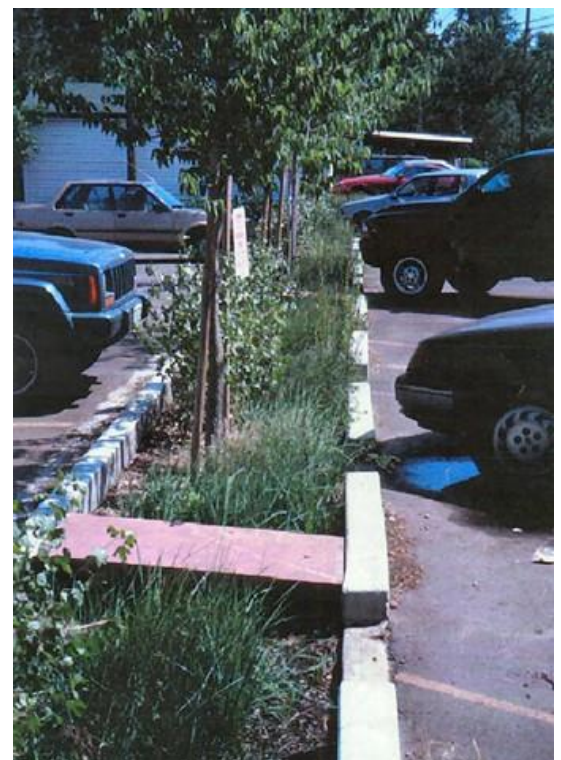
Solisyon Raingarden pou wizèlman pakin yo.