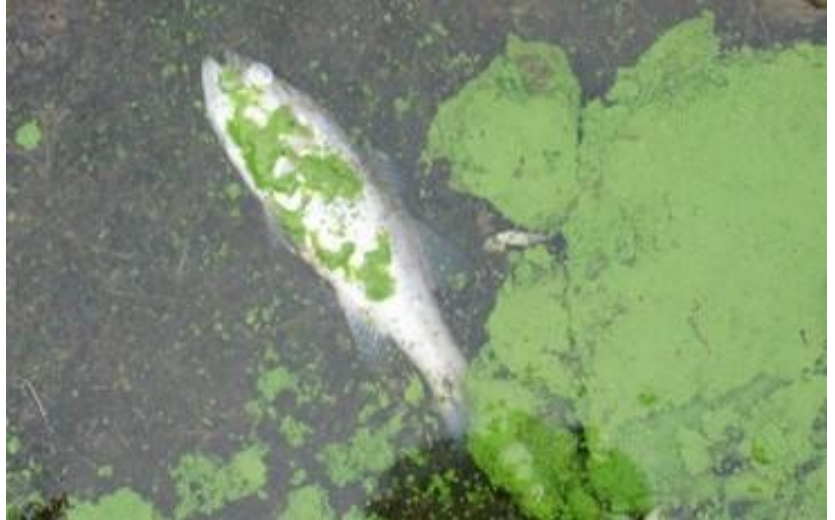
Pwoliferasyon alg yo kapab nui fòn yo.

Dlo lapli ki tonbe sou yon sifas ki di tankou pakin ak twati yo ka kapte polyan ki pote yo nan rivyè lokal yo apre sa. Dlo wisèlman polye sa a, yo konnen tou sou non "dlo lapli," koule sou sifas di sa yo dirèkteman pou ale nan kanal yo, kidonk pa gen opòtinite pou tè ak plant yo absòbe dlo lapli a epi filtre polyan yo. Polyan sa yo ka lakoz pwoliferasyon alg vèt yo ki ka nui moun, fòn nan, ak bèt domestik yo. Epi bakteri ki soti nan dechè chen yo ak bèt sovaj yo ka rann dlo a pa pwòp pou benyen ak pou lapèch kokiyaj.